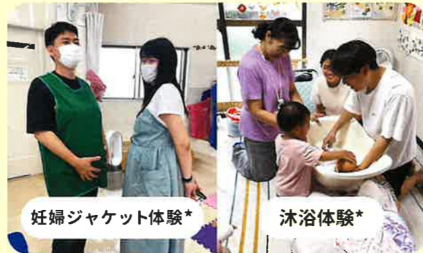
妊婦ジャケット体験* 沐浴体験*