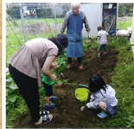
やっと会えたSボラさん やっと触れられた土