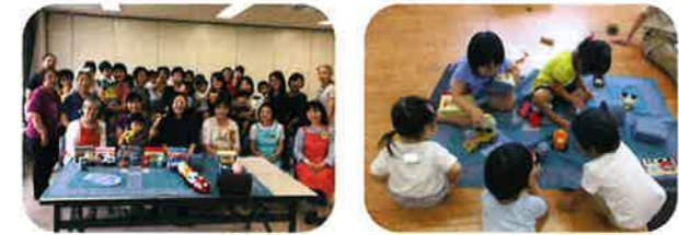
7月5日の港北区生涯学級「布であそぼう～ちくちく～」最終日に伺い、素敵な贈り物をいただきました。

7月5日の港北区生涯学級「布であそぼう～ちくちく～」最終日に伺い、素敵な贈り物をいただきました。よこはま布絵本ぐるーぷさんが講師となり、参加者の皆さんが縫ってくださったものです。お披露目の瞬間は大歓声があがるほどの大作、その名も「ドライブゲーム」!道路マットやお店屋さん、ガソリンスタンドに信号まで。好きなところに置いたら、色とりどりの車を走らせませす。楽しい仕掛けもあるドライブゲームでぜひ遊びに来てくださいね!制作に関わってくださった皆さま、本当にありがとうございました。