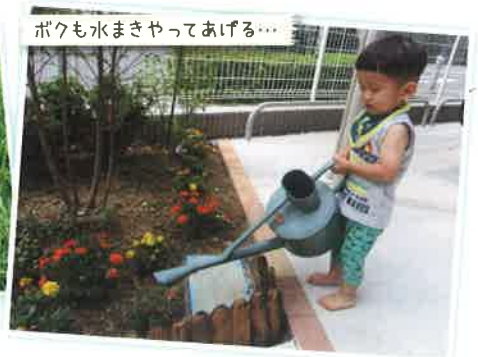
ボクも水まきやってあげる…