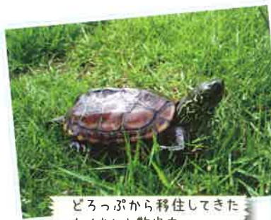
どろっぷから移住してきた カメさんお散歩中

おかず・飲み物は、お持ちください。 食事の時間は12:00 ~ 13:30です。