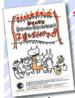
新吉田地域ケアプラザ、どろっぷなどで配布しています。