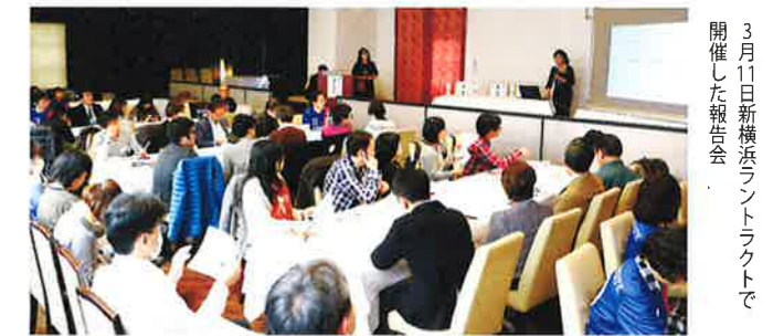
3月11日新横浜ラントラクトで開催した報告会

※WEBページ▶ https://codeforkohoku.github.io/papamama/