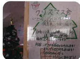
招待状を兼ねたサテライト館内掲示

いずれサテライトを巣立ち地域へと羽ばたく親子にとって、近隣小学校との連携は心強いものです。