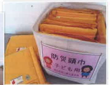
子ども用の防災頭巾も用意！