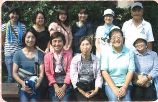
WAIWAIみんなの箕輪クラブ運営スタッフの皆さん

公園は広く一面が見渡せる環境。ブルーシートには地域の方が作ってくれた木の大型おもちゃなどが準備されており、子どもたちが無心になって遊ぶ姿も!思い切り遊んだあとは日吉地区の保育グループ『ポコアポコ』の方による手遊びやシアターなどのお楽しみタイムもありました!自由遊びがメインですが、季節の行事も楽しめる内容になっているとのこと。スタッフの方は様々な立場に関わり幅広い年齢層となっているため、子どもたちと一緒に遊んだり、ママたちとおしゃべりしたりする様子を見て異世代交流の場ともなっているんだなと感じました。遊びの前には公園清掃も行っていました。こうやって、地域の方に支えられていることも本当にありがたいですね。