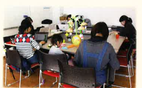
どろっぷ2階研修室で英語版あつとどろっぷ作成などそれぞれが活動

⇐下田にある空き家活用をした「えんがわの家よってこしもだ」で多様な人が集まって夜な夜なパソコン作業