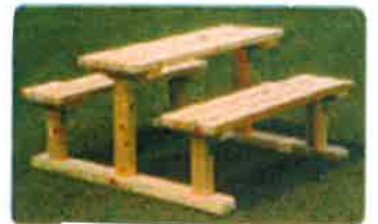
↑ ベンチセットで遊んでね

どろっぴにとって大切な庭。狭いけれど、この庭には、子ども達がどろっぴで過ごす時期に、砂や泥に触れられる環境を大切にしたいという思いがこめられています。これから風の心地よい季節に、子どもたちが、このテーブルで、おままごと遊びをするかな、もしかしたらよじのぼったりお昼を食べたりするかな、ほかにどんな風に遊ぶのかな・・・そんな楽しい光景を、大人も見て過ごせたらいいな♪と思っています。