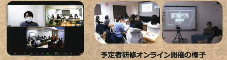
予定者研修オンライン開催の様子

講師、地元消防団、初の取り組みをバックアップしてくれた多くの方々の協力があり実現できました。「つながりを紡いでいく人」がそこに確かにい