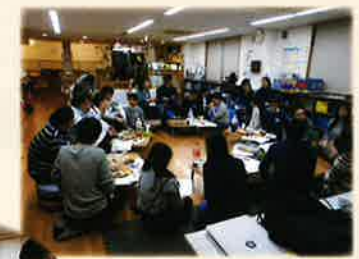
報告会後は交流会も開催♪