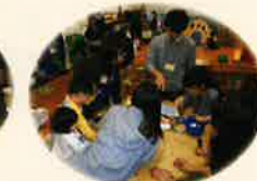
ひろばでココアプリのヒアリング